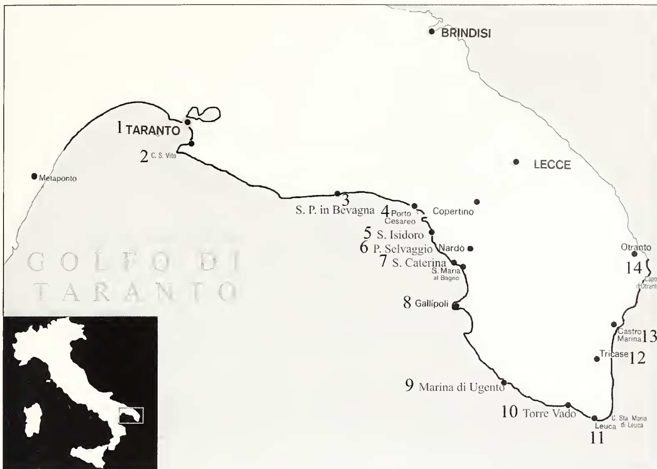
Fig. 1. Area oggetto della ricerca.